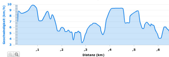
Leistungskurve Naish Javelin bei unterschiedlicher Geschwindigkeit auf 600m Distanz: harmonischer Geschwindigkeitsverlauf.