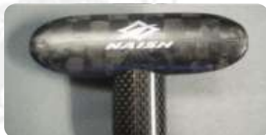
Latexüberzug für optimalen Grip