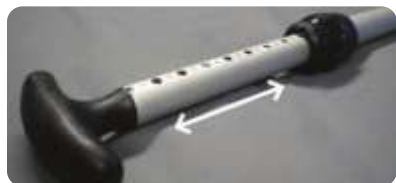
Längenverstellbarer Paddelholm (nur Alu Paddel)