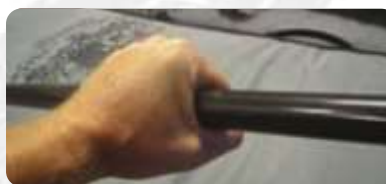
Reduzierter Holmdurchmesser (RDS)