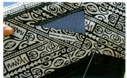
Ein kleines Gitterfenster in den Tips soll den Wasserabfluss beim Relaunch beschleunigen