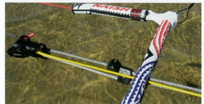
Alles, was eine schöne, funktionelle Bar braucht: Wirbel, Stopper, gutes QR und Polsterungen sind mustergültig. Für größere Kites lassen sich die Steuerleinen weiter außen anknüpfen.