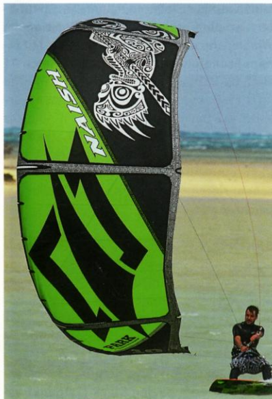
Pralle Freude: Der Park überzeugt durch eine sehr stabile Fluglage