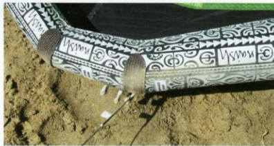
Drei Anknüpfungspunkte für die Frontleinen: So kann man die Position im Windfenster beeinflussen. Auch für die Steuerleinen gibt es verschiedene horizontale und vertikale Optionen.