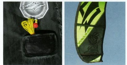
Links: In einem Täschchen steckt das Leichtwind Relaunch System, das bei ultraleichtem Wind beim Restart helfen soll. Es muss allerdings vor dem Start angeknüpft werden.